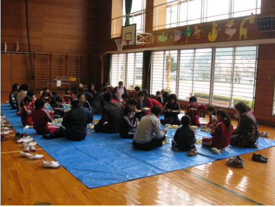
〈外の桜を見ながら、体育館でのお花見給食〉

給食も始まりました。みんなでランチルームで食べる給食は楽しいですね。おかわり をする子も多いです。みんなが楽しみにしていた桜の下でのお花見給食が雨のせいで場 所が体育館に変わったのは残念だったけど、これからも、楽しくおしゃべりしながらし っかり食べましょう。4月はいろいろなことが始まるから、体も疲れやすくなります。 寒い日もあるので、カゼなどをひかないようにしましょう。